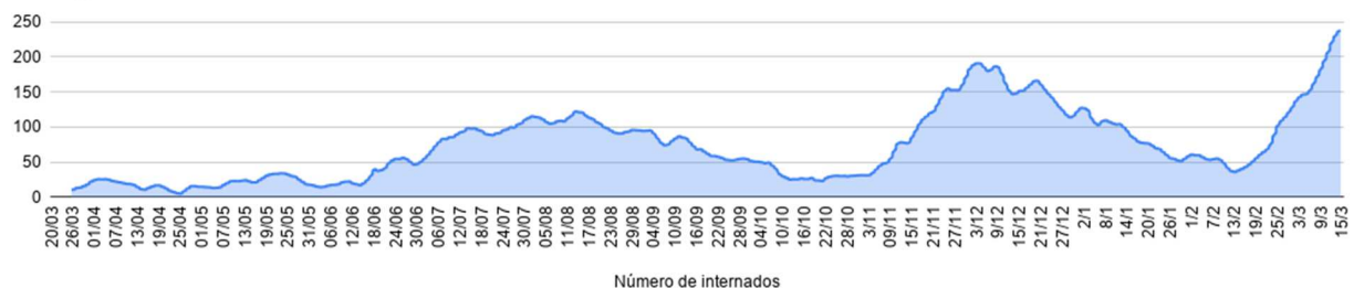
Histograma de Número de internados