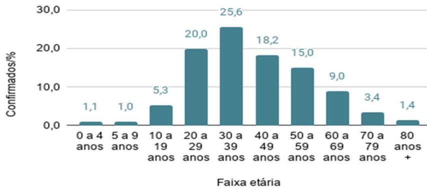
Gráfico 2 – Média de casos por semana, Criciúma/SC: